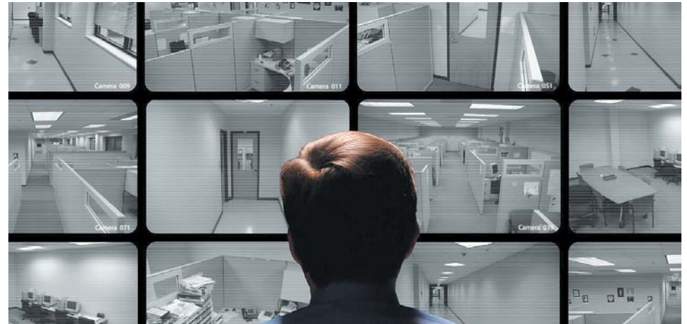
A portaria virtual é proibida e os condomínios que estão implantando já estão sendo condenados pela Justiça do Trabalho

São inúmeras as notícias que a falta de energia deixou moradores presos na gaiola; síndicos que ficaram na portaria abrindo e fe-